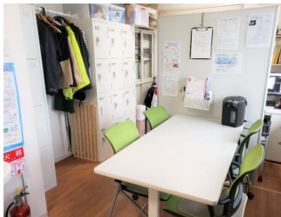
休憩室・ 個別ロッカー