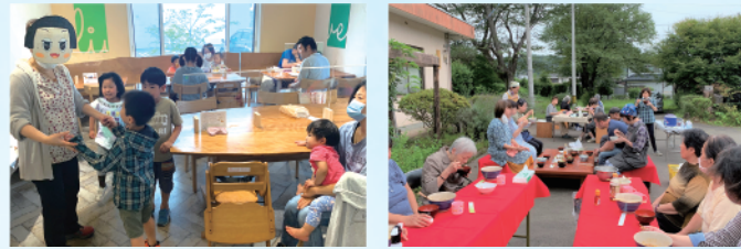
子どもレストラン