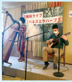
ベネズエラハーブ演奏会