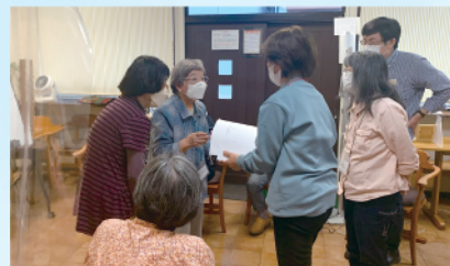
誰でも参加できるSST