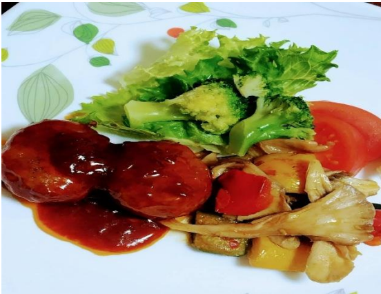
グループホームでの食事